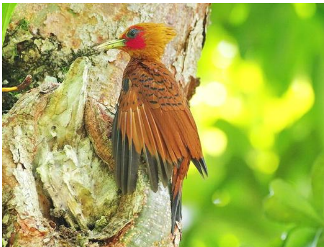
Сергей Волков

Было видно, что ему больно от укусов, он мотал головой, постоянно встряхивался, но не улетал, выдержав минуты две-три. Такие процедуры протравки собственного оперения муравьиной кислотой практикуют многие виды сов, врановых, куриных, дятлов. Обладая инсектицидными свойствами, муравьиная кислота помогает птицам избавляться от кожных и перьевых паразитов - пухоедов, блох, клещей.